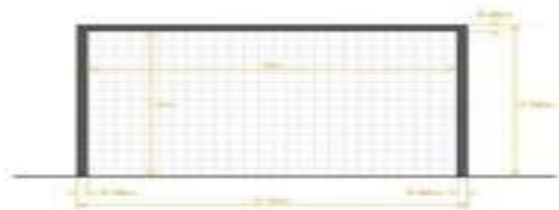
Gambar 2. Gawang Futsal

Dalam permainan futsal, gawang adalah alat yang dituju oleh lawan untuk mencetak gol. Gawang dalam pertandingan futsal diposisikan di tengah-tengah garis gawang. Garis gawang itu sendiri terletak di garis batas lapangan futsal. Tiang gawang futsal memiliki tinggi 2 meter dan lebar 3 meter dari permukaan lapangan. Kedalaman gawang adalah 80 cm pada bagian atas dan 100 cm pada bagian bawah dengan ketebalan tiang gawang 0,08 meter.